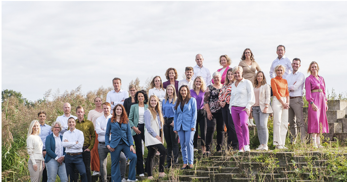
Bijdrage van Vrieling Adviesgroep